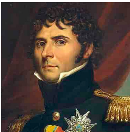
a) Karl Johan

Norge hadde tre konger i løpet av 1814. Hvem av kongene under var ikke konge da Grunnloven ble skrevet?