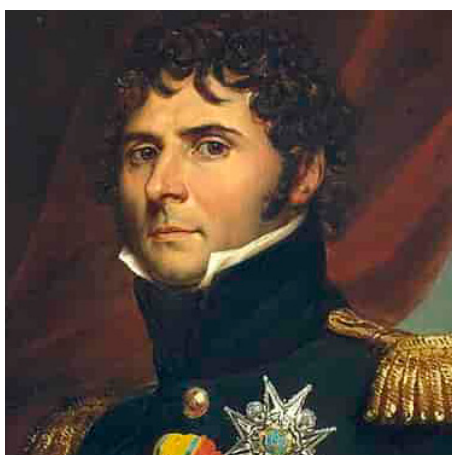
a) Karl Johan

Noreg hadde tre kongar i løpet av 1814. Kven av kongane under var ikkje konge då Grunnlova vart skriven?