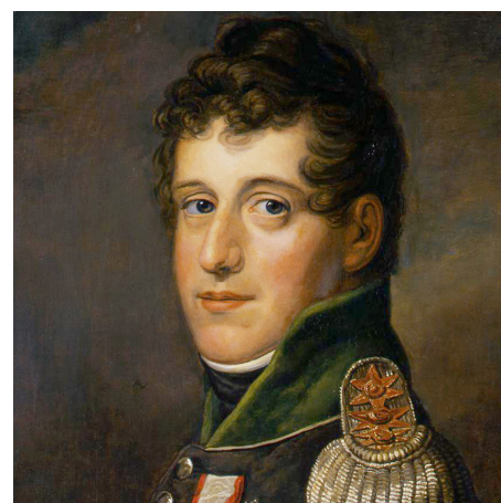
c) Christian Frederik